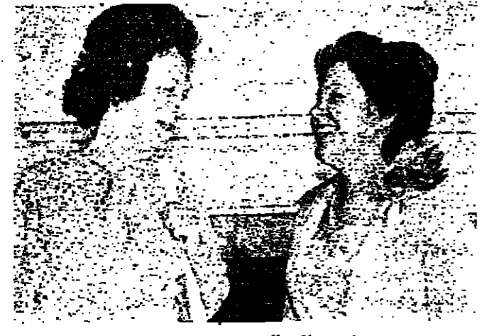
مقابلة الوزير فهمي (الى اليمين) ومقابلة كالاها في لندن

وقد تمسح به الظروف. وقد تمسح به الظروف. وقد تمسح به الظروف.